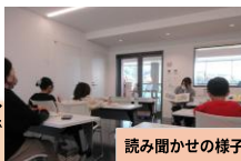
読み聞かせの様子

また、ただ本を作成するのではなく、『ルリユールおじさん』『はたらく製本所』などの、製本に関する本の読み聞かせや展示も行った。楽しみつつも、新たな学びを得られる空間が形作られた。